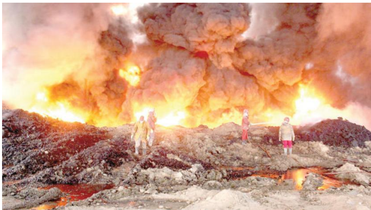
دیمه‌نی گرگرتوی بیر نه‌وته‌کانی گه‌یاره به‌هۆی ته‌قاندنه‌وه‌یان له‌لایه‌ن داعشه‌وه‌ (2016)

له‌ (تشرینی دووه‌می 2016) داعش بیر نه‌وته‌کانی گه‌یاره‌ی له‌ موسڵ ته‌قاندنه‌وه‌، له‌ ئه‌نجامدا زیان به‌ر (97) بیر نه‌وت که‌وتن، که‌ نۆژنه‌کردنه‌وه‌ به‌گه‌رخستنه‌وه‌یان زیاتر له‌ (200) ملیۆن دۆلار تیچووی هه‌بو، (21) بیر ته‌واوه‌تی له‌ کیلگه‌که‌دا له‌ که‌لک و بایه‌خ خران. ئاگر و گرێ ژه‌هراویه‌که‌ی بۆ ماوه‌ی (8) مانگ به‌رده‌وام بو (13) ، عێراق که‌ نزیکه‌ی (100) ساله‌ نه‌وتی خۆمائی کردوه‌، له‌توانیدا نه‌بو بیکوژینیته‌وه‌، توانای ته‌کنیکی له‌ کوه‌یت و چه‌ند شوینیکی ده‌روه‌ بۆ په‌یدا کرد. له‌ ئه‌نجامدا چه‌ندین جو‌ری ماده‌ی وه‌ها پیس خرایه‌ ژینگه‌وه‌ که‌ وولاتیکی گه‌وره‌ی پیشه‌سازی له‌ سالیکیدا ئه‌وه‌نده‌ زیان به‌ ژینگه‌ و پیسبونی هه‌وا ناگه‌یه‌نیته‌، جگه‌ له‌وه‌ی له‌ ده‌روبه‌ری گه‌یاره‌ زیاتر له‌ (100) خێزان مالبه‌ده‌ر بون و ناوچه‌که‌ به‌ که‌لکی ژیان نه‌ما!.