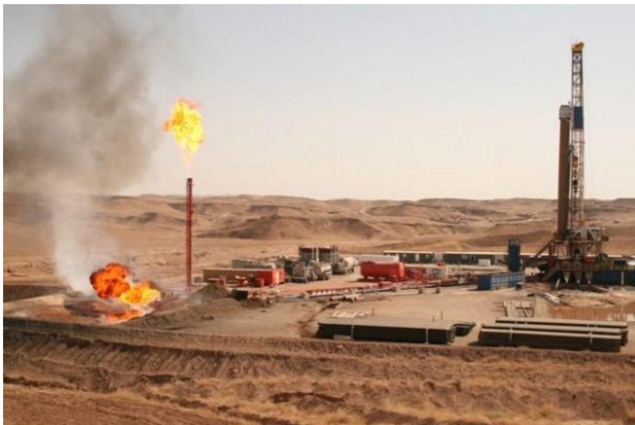
کارکردن لە کێلگەى نەوتى شىخان – کۆمپانیای گۆلف کىستون

جگہلہ ھەموو ئەمانە، دامەزراندنی کۆمپانیایەک لەبوارى نەوتى يان بوارەکانى تردا، لە وولاتانى خۆرئاوا بەگشتى و ئەوروپا بەتایبەتى تەنها (۲۰۰$) دووسەت دۆلارى تى ئەچیت، ھەركەسىك ئەچیت و بە ئاسانى تۆمارى ئەكات لەو وولاتانەو، وىب سايىتىك بە كۆمەلىك بابەتى قەرەبالەخ و دروشم و وینەى سەرنجراكىشەو دانهات. ئىنجا دیتەو لە عێراق چەندىن تەندەرو گریبەست و مرنەگریت و ھاوبەش بۆ خۆى پەيدائەكات. لەبەرانبەردا بۆ دامەزراندن و تۆمارکردنى يەك كۆمپانیای بوارى خزمەتگوزارى نەوتى لە عێراقدا پىويستى بە برى (۳) سى ملیار دینار ھەيە!. ئيتىر ئەمە ھۆيەكى ئاشکراو ديارە كە بۆچى كەرتى نەوتى نىشتىمانى پيش ناکەوێت.!