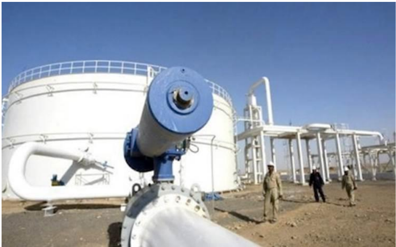
کاری ئەندازەکاریی لە کێلگە ی خورمەلەدا

قەزای دووزو و دووزیشی خستوبه سەر پاریزگای سەلاحەدین. بە هەمان شێوە کێلگە ی پەلکانە یان گەرمیان لە هەر ئالۆگۆر و جموجوڵێکی ئێران یان میلێشیاکاندا بە ئاسانی ئەکەونه بەردەم مەترسی لەناوچوون. پەلکانە سەر بەخانەقین و دیالەیه. بەلام هەریم مامەلە ی بەو ناوچانەوه کردوه (هەلبەت هەموو ئەو ناوچانە بێ هیچ ئەملاولایەک سەر بە خاکی کوردستانن).